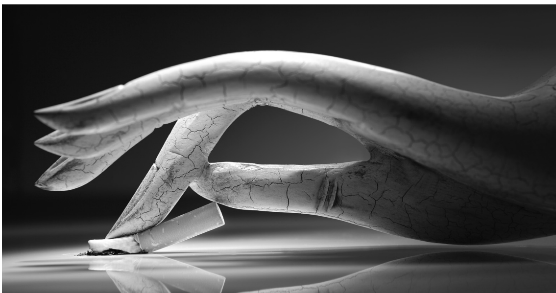
Le tabagisme a été récemment identifié comme un élément déclencheur de l'acné chez l'adulte.

« L'aspect clinique des acnés de la femme adulte est différent de celui de l'adolescente. En effet, l'acné survient sur une peau beaucoup moins séborrhéique et atteint plus volontiers le bas du visage : la région mandibulaire, sous-maxillaire et le menton. Il s'agit de lésions principalement inflammatoires avec parfois des nodules du menton ; les microkystes sont néanmoins fréquents. Les séquelles pigmentaires et atrophiques sont courantes. L'atteinte du dos et du décolleté n'est pas rare. Dans notre enquête, plus de 90 % des femmes reconnaissaient manipuler et excorier leurs lésions ; 49 % des femmes présen-